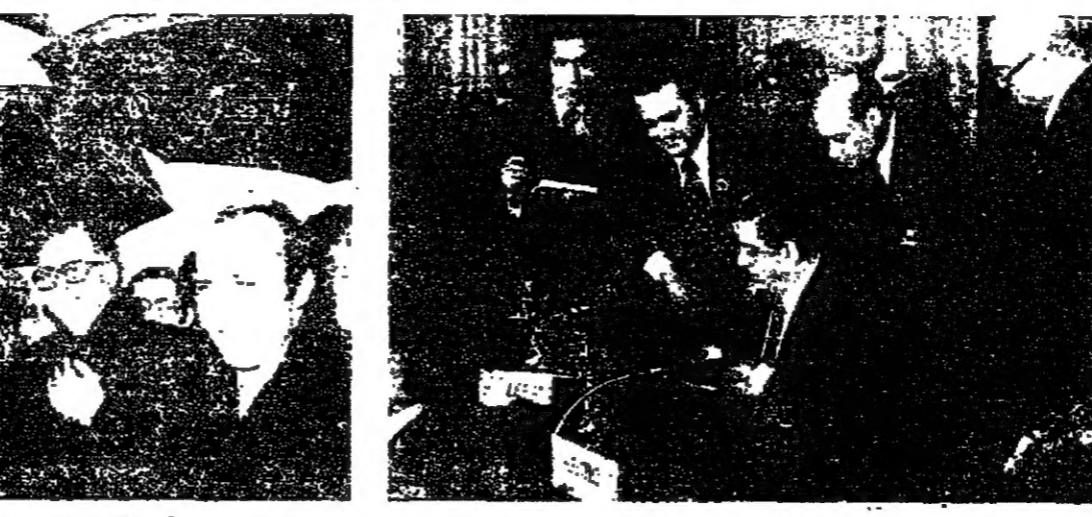
يوثق تراتبات القمة